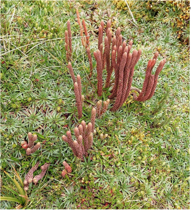
Terrestre y erecto