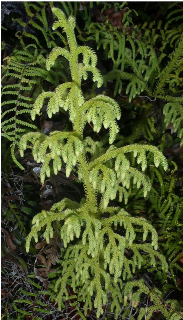
Erecto con ramas laterales