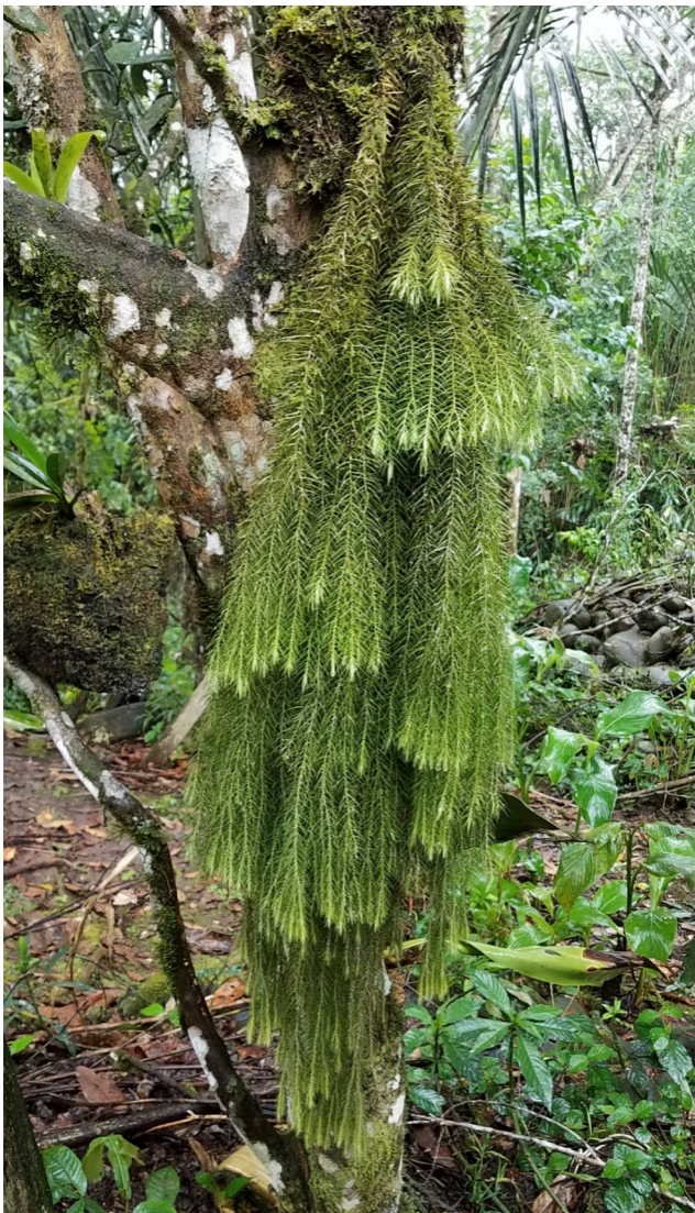
Epifítico y pendulo