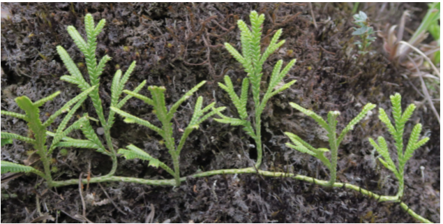
Terrestre y reptante