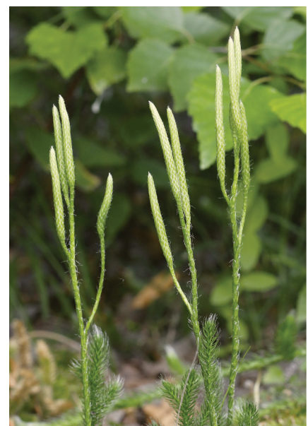
Lycopodium: estróbilos pedunculados