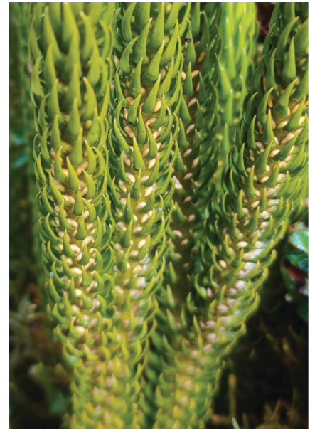
Huperzia: esporangios axilares