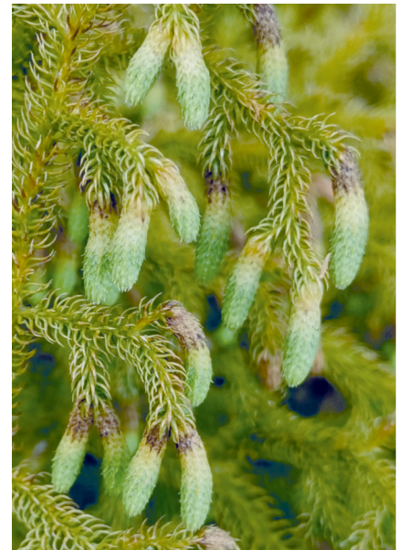
Lycopodiella: estróbilos terminales